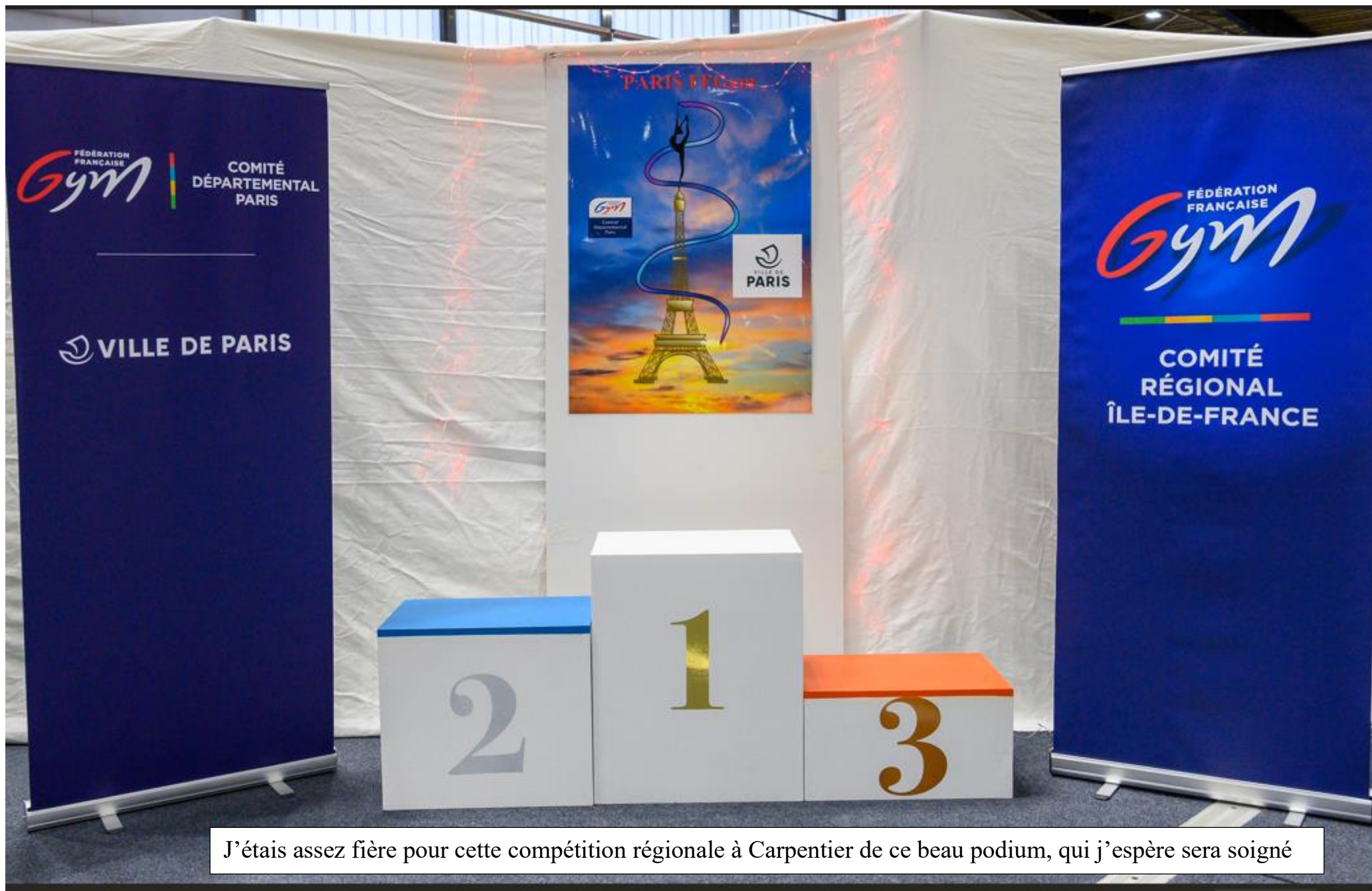
J'étais assez fière pour cette compétition régionale à Carpentier de ce beau podium, qui j'espère sera soigné